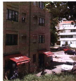
Moravam no Bairro da Pasteleira, localizado na cidade do Porto

O casal incorre agora em dois crimes. Falsificação de documentos e burla agravada. ■