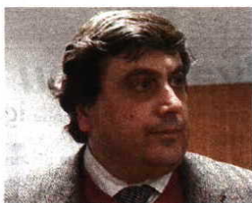
Director da PJ do Porto