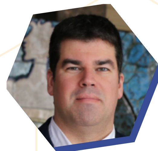
Ricardo Mexia Presidente da Associação Nacional de Médicos de Saúde Pública