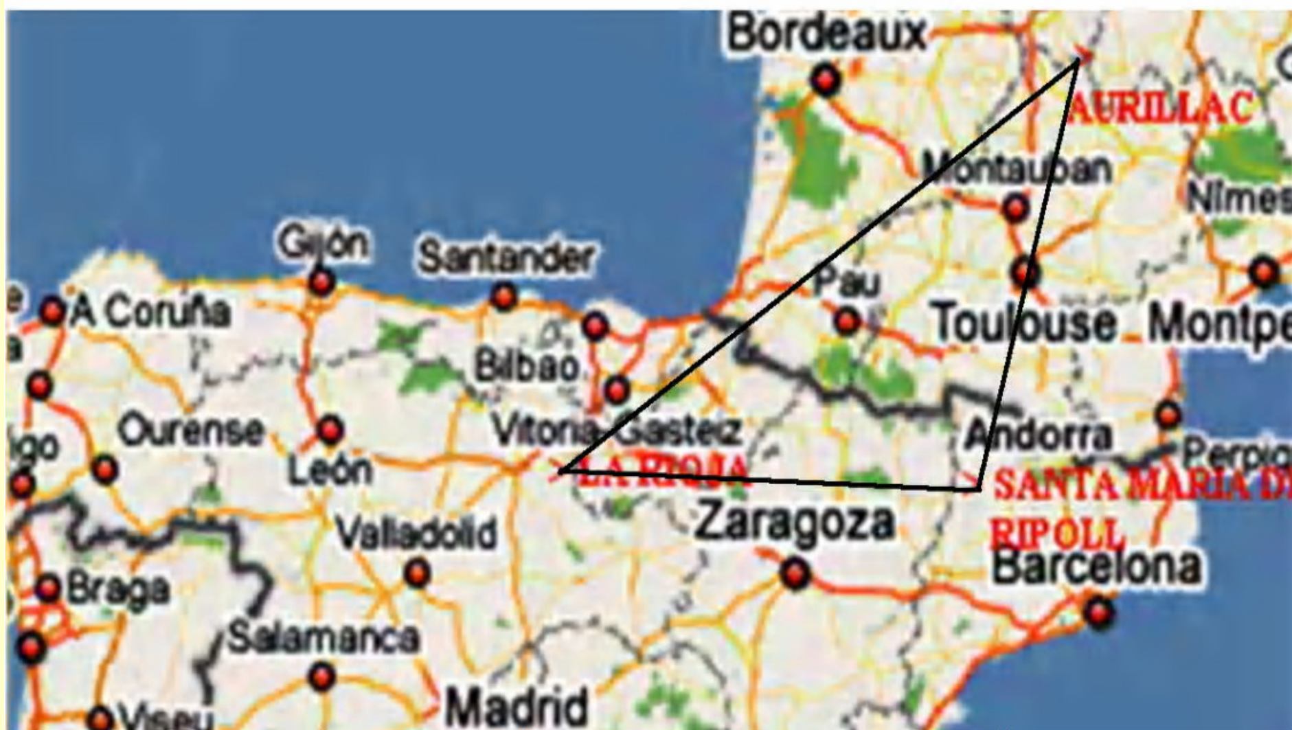
ILUSTRACIÓN 5. TRIÁNGULO DE APARICIÓN DE LOS NÚMEROS ARÁBIGOS EN OCCIDENTE