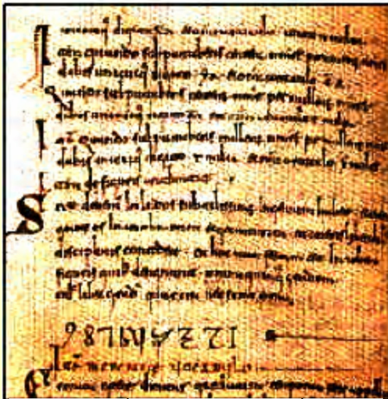
ILUSTRACIÓN 4. PRIMEROS NÚMEROS ÁRABES ESCRITOS EN OCCIDENTE