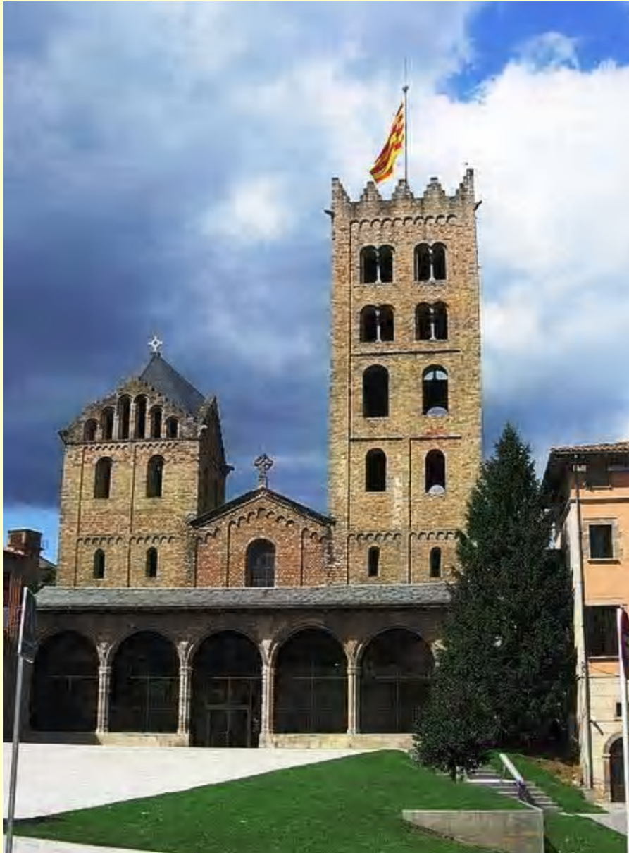
ILUSTRACIÓN 2. MONASTERIO DE SANTA MARIA DE RIPOLL