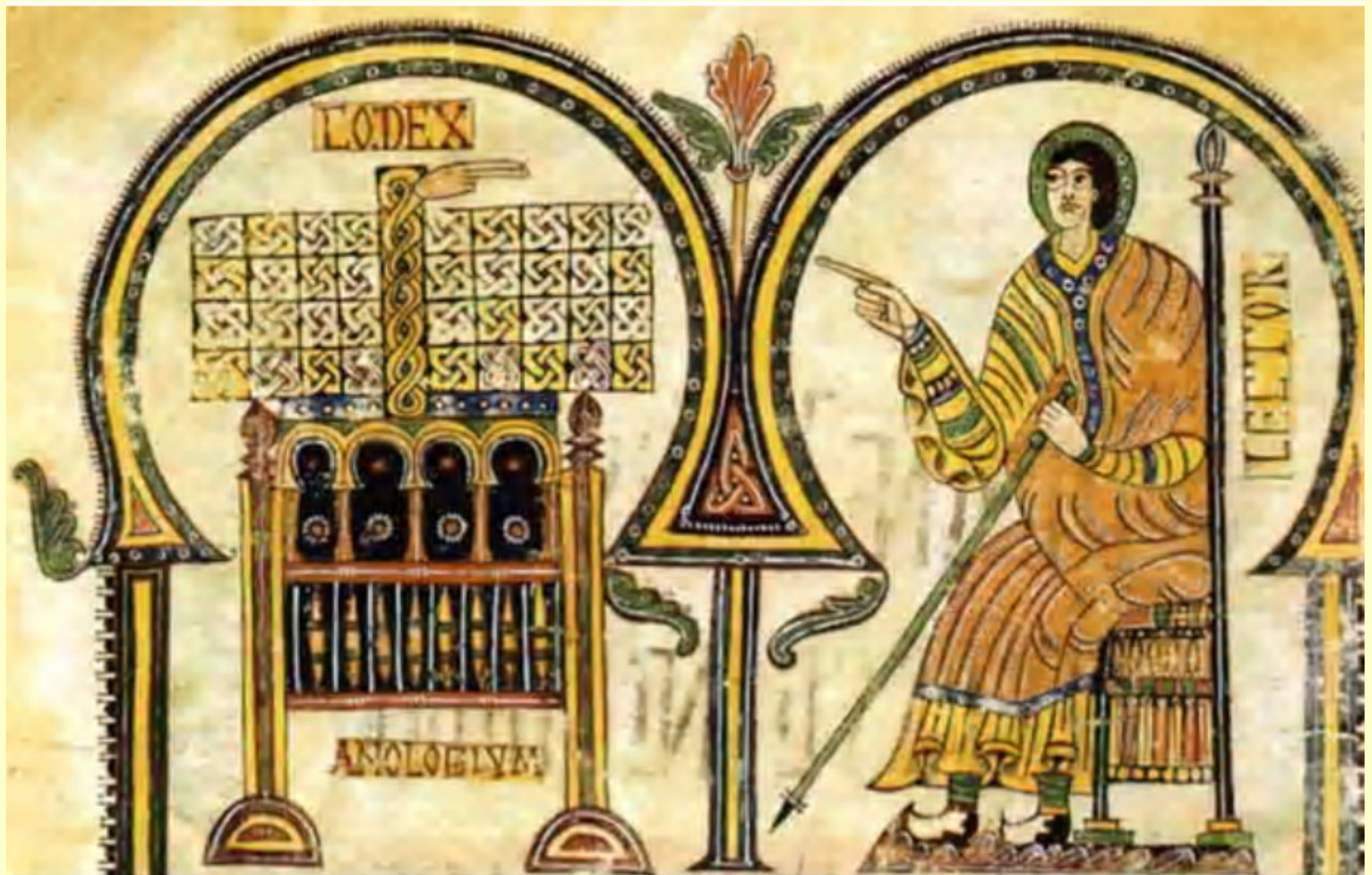
ILUSTRACIÓN 3. CODEX VIGILANUS O ALBENDENSIS . EL MONJE VIGILA MOSTRANDO AL LECTOR SU CÓDICE